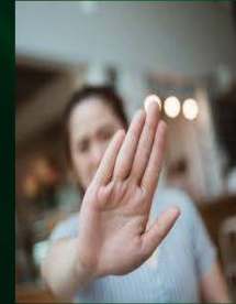
Stoppen of minderen